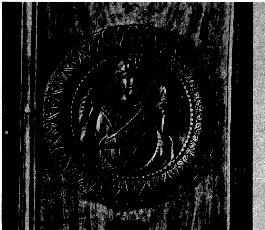
Abb. 3, 4. Medaillons vom Diptychon des Konsuls Apion. Oviedo, Spanien